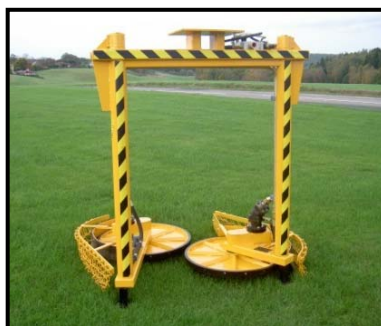
Tillbehör: HG stolpklippare

Alla ovanstående data kan ändras utan föregående meddelande.