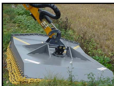
Tillbehör: HG kättingaggregat