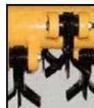
Universalslagor + mittslaga Ø max 5 cm