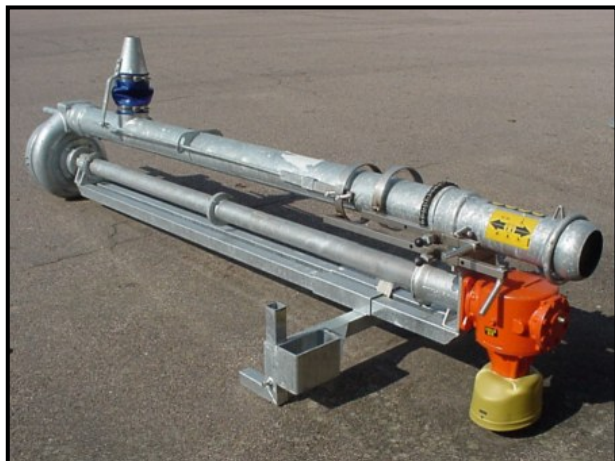
Modell Super 150.