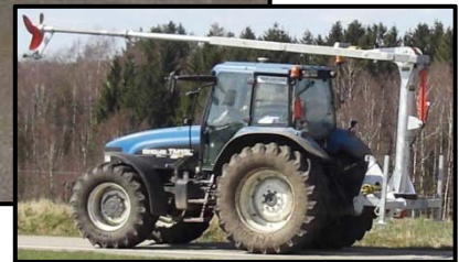
Hydrauliskt vridhus 360 grader.