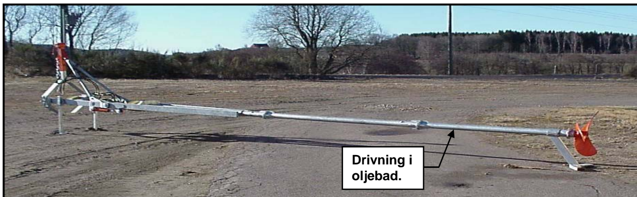
Modell MOVRED HYDRO avsedd för låga brunnar